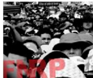
Con tomas de carreteras, movilizaciones y otras formas de protesta pacífica, se realizaron las actividades del segundo Paro Cívico Nacional del 12 de abril.

Fue la segunda acción de presión de alcance nacional que se realizó en menos de 15 días. Sus principales banderas de lucha fueron: El rechazo a la privatización de la educación, la exigencia de que se paren las alzas al combustible y la canasta básica, que se garantice el retorno seguro del Coordinador General del Frente Nacional de Resistencia Popular (FNRP) Manuel Zelaya Rosales, que se detenga la política de irrespeto a los derechos humanos por parte de la dictadura.