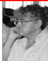
Por: Pepe Mejía, desde Madrid

En 2006, Islandia disponía de mayor renta per cápita que Estados Unidos o Reino Unido. En 2007, Naciones Unidas la declaraba «mejor país del mundo para vivir». Hoy, Islandia, la niña bonita y paraíso del neoliberalismo, está viviendo una revolución que no se transmite en directo porque no hay balas, no hay muertos, no hay tanques, no hay manifestaciones tumultuosas, barricadas ardiendo, pedradas y gente con la cabeza abierta. Los grandes medios de comunicación intentan silenciarla para evitar reforzar la vía islandesa de salida de la crisis financiera. La crisis ha sacado a los islandeses a la calle para practicar el cacerolazo contra los bancos. Lanzan lechugas a los políticos y depositan las llaves de los coches ya embargados en las puertas del Parlamento.