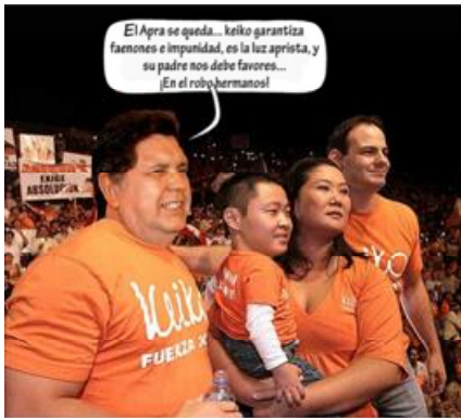
Ya sabemos por quien vas a votar (borrón y cuenta nueva)

“No he tomado una decisión y si la tomo no diré nunca por quién voy a votar, si por la señora Fujimori o por el señor Ollanta. Pero a ninguno de los dos podría malquerer u odiar por cuenta de lo que hizo el padre de una o de lo que me insultó otro en una ocasión anterior. La vida es muy grande y, como dice Shakespeare, all is well when ends well: “Todo está bien cuando acaba bien”. Y las cosas van a acabar bien en el Perú, a pesar del temor del momento”, concluyó.