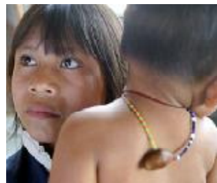
Por los niños y niñas masacrados en el norte del Cauca

Eso lo vivimos en el Perú, ahora lo sufren los indígenas colombianos. Denuncian: «Vienen con balas, con proyectos, con negocios. Vienen a privatizar el agua, la tierra, las minas. Vienen a convertir el trabajo de la gente en mano de obra para los mega-proyectos. Vienen a convertir a los niños y las niñas muertas, en cifras que justifiquen plata para proyectos. Convierten en mercancía el dolor.»