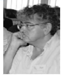
Por: Pepe Mejía, desde Madrid

"No es una crisis cariño, es que ya no te quiero".