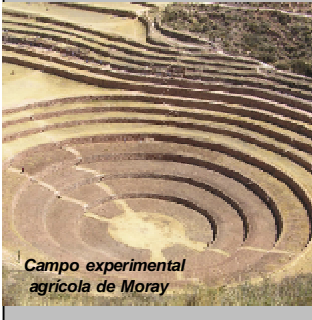
Campo experimental agrícola de Moray

La Organización de las Naciones Unidas para la Agricultura y la Alimentación (FAO) y la Secretaría Técnica de la Iniciativa "Sistemas Importantes de Patrimonio Agrícola de la Humanidad" (GIAHS, por sus siglas en inglés) acreditaron a los Sistemas Agrícolas Andinos del Perú como Patrimonio Global de la Humanidad. Este reconocimiento se realizó en el marco del Foro Internacional: "Globally Important Agricultural Heritage Systems (GIAHS)", en Beijing - China, del 9 al 12 de junio organizado por la FAO y la Academia de Ciencias de China. Durante el evento, al que asistieron 125 representantes provenientes de China, Argelia, Italia, Canadá, Tanzania, Túnez, Japón, Filipinas, Chile, Francia, India, Sri Lanka, Brasil, Bélgica, Kenia, Marruecos y Perú, se analizaron las experiencias más importantes a nivel mundial sobre la conservación dinámica de los sistemas agrícolas tradicionales.