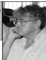
Por: Pepe Mejía, desde Madrid

Las recientes movilizaciones ocurrida en España el pasado 19J y las de Grecia, al cierre de este artículo, presagian de que en Europa empieza a articularse un amplio movimiento popular de oposición y enfrentamiento a la crisis y el capital. Por primera vez se ataca al corazón mismo del sistema. A las bases mismas del sistema. Y estamos, y lo hemos constatado y se constata cada día en diversos frentes, la fortaleza del movimiento de los indignados e indignadas.