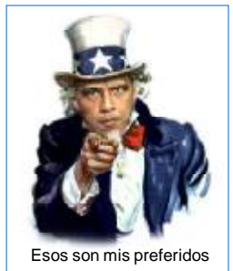
Esos son mis preferidos

El senador Sanders propuso la creación de una ley para imponer un 5.4% de sobrecargo impositivo para los millonarios, lo que incrementaría en 50 mil millones de dólares la recaudación tributaria anual. La propuesta del senador fue denegada pero su mensaje hace eco en todos aquellos que se sienten abandonados por el estado: «Tenemos un problema de déficit y tenemos que afrontarlo, pero no podemos hacerlo de manera que éste caiga sobre las espaldas de los enfermos, los ancianos, los pobres, los jóvenes, la gente más vulnerable en este país. La gente más rica y las mayores corporaciones tienen que contribuir», dice el político.