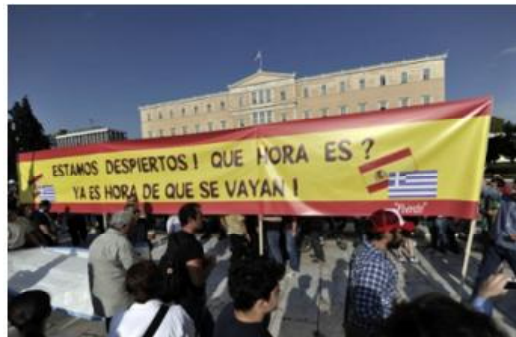
Banderola de una manifestación en Grecia con los colores de la bandera de España y en el flanco derecho la de estos dos países

Por otro lado, Grecia también nos marca nuevos retos. La violenta represión y la participación intergeneracional. En estas recientes movilizaciones se han visto juntos en la calle ancianos, jubilados, prejubilados, mujeres, inmigrantes -en España, la inmigración aporta al Estado más de lo que cuesta, según un estudio financiado por la Fundación la Caixa-, parados y parados y jóvenes altamente cualificados compartiendo la lucha. La batalla no ha hecho más que comenzar. Nos espera un otoño muy caliente porque la gente está dispuesta a exigir en la calle la cancelación del paquete de las medidas económicas.