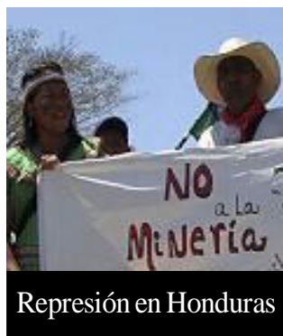
Represión en Honduras

¡Triunfo de la lucha indígena en defensa de la Madre Tierra!