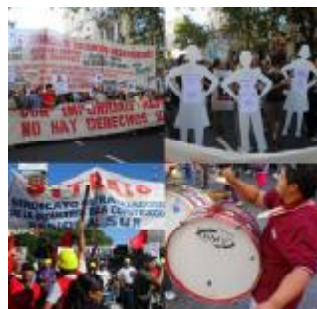
Cientos de miles de jóvenes nutrieron las columnas de manifestantes encabezadas por Madres y Abuelas

«Cada asesinado, cada asesinada, todos se vuelven raíz en la tierra, y se envuelven en la memoria de resistencia de nuestros pueblos a los genocidas desde los tiempos de la Conquista.»