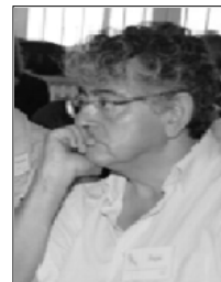
Por: Pepe Mejía, desde Madrid

Portugal se suma a la ola de movilizaciones contra los planes de ajuste. 300.000 personas se congregaron en las calles de Lisboa para protestar contra «la precariedad». La mayor movilización desde la revolución de los claveles del 25 de abril de 1974. Los jóvenes —que portaban pancartas con los lemas «La precariedad no escoge edad» y «El país está en apuros»— han sido protagonistas de las protestas por la falta de empleo y la disminución de sus condiciones de vida. Convocados por la agrupación Generación Precaria —al margen de partidos y sindicatos aunque algunos de sus promotores militan o han militado en las juventudes del Partido Socialista, Comunista y del Bloco de Esquerda— las movilizaciones se extendieron a otras 11 localidades portuguesas.