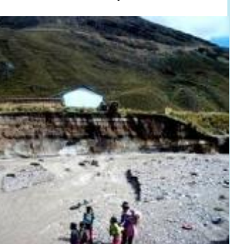
Foto: Río Occoro - Huancavelica setenta.

la quebrada, el cobrador y el chofer nos aseguraron que al otro lado de la carretera malograda nos esperaba otro vehículo de la empresa pero sin embargo no había nada, los pasajeros en su mayoría eran madres beneficiarias del Programa Juntos que viajaban hasta Izuchaca a cobrar el pago del mes. Salimos desde Nuevo Occoro kilómetro 32 recogiendo muchas madres con sus hijos cargados y otros jalados de la mano,