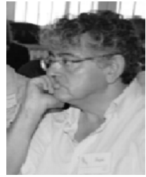
Por: Pepe Mejía desde Madrid

E y, por supuesto, Francia, los estudiantes han sido los protagonistas de las movilizaciones en contra de las políticas liberalizadoras y las reformas laborales. En el Reino Unido, los estudiantes se han enfrentado durante todo el día a la policía en los alrededores del Parlamento y han llegado a atacar el coche en el que viajaban el príncipe de Gales y su esposa. Los manifestantes arrojaron un bote de pintura contra el vehículo, empezaron a darle patadas y llegaron a romper uno de los cristales, según un testigo. Multitudinarias han sido las manifestaciones de estudiantes y enfrentamientos contra la reforma universitaria. El resultado se aprobó por tan solo 21 votos de diferencia. Un margen cuatro veces menor que la mayoría de la que el Gobierno disfruta a diario en los Comunes. Según sus planes, las tasas universitarias subirán de 3.200 a 9.000 libras anuales (de 3.800 a 10.600 euros). Una cifra que ha desatado la ira estudiantil. La violencia está marcando la aprobación por los Comunes del polémico incremento de las tasas universitarias. El Gobierno de coalición ha aprobado con 323 votos a favor y 302 que las tasas universitarias pasen de los actuales 4.100 euros al año a un máximo de 10.700, aunque