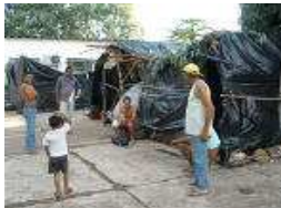
Campamento frente al Instituto de Colonización y Reforma

El MST (Movimiento de los Trabajadores Sin Tierra) es uno de los movimientos sociales más importantes del mundo y, por supuesto, de Brasil. Sus señas de identidad pasan por la lucha por la tierra, la reforma agraria y avanzar hacia el socialismo. Todo ello con una clara apuesta por la producción agroecológica libre de transgénicos.