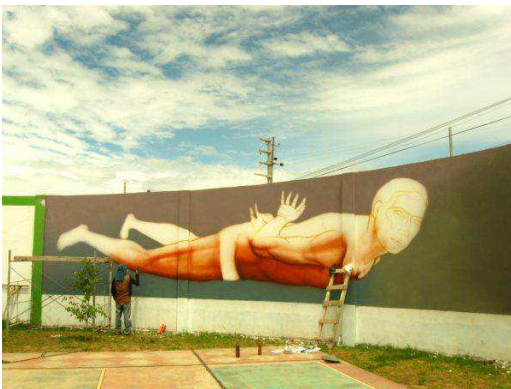
Mural El Interrogatorio