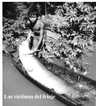
Las víctimas del friaje

El Instituto de Investigaciones Amazónicas del Perú (IIAP) dice tener un programa de adaptación al cambio climático. Esto es una soberana estupidez, porque cada vez serán peores los efectos de la alteración del clima y no resucitarán vegetales ni animales muertos.