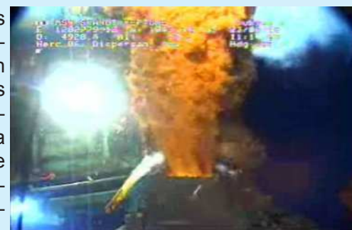
En esta imagen distribuida por BP PLC el miércoles 23 de junio en la mañana, aparece el crudo brotando hacia el mar en el Golfo de México.

perforación submarina aceptaron boletos para eventos, almuerzos y otros regalos de compañías petroleras y de gas y usaron computadoras del gobierno para ver pornografía, reveló un nuevo reporte del Departamento del Interior de Estados Unidos. «Descubrimos que los individuos involucrados en la fraternización y el intercambio de regalos _ tanto en el gobierno como en la industria _ a menudo se conocían desde niños», dijo la inspectora general Kendall.