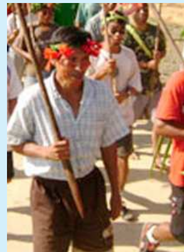
A un año de masacre de bagua y los responsables gozan de la impunidad

¡Por un país amazónicos, andino, y costeño intercultural!