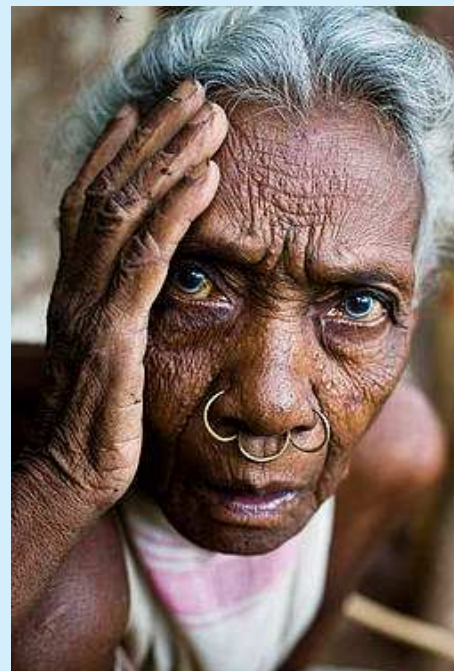
Las colinas de Niyamgiri, Orissa, India, Ella es una de las muchas personas que serán desplazadas si la empresa de aluminio Vedanta continúa con sus planes de la mina de bauxita en Niyamgiri Hills.

Los donghria kondh son uno de los pueblos indígenas más remotos de la India. Viven en las colinas de Niyamgiri, en el estado de Orissa, y veneran una montaña como a un dios. Mientras Vedanta Resources, una empresa con sede en Londres, se prepara para destruir sus bosques y su montaña sagrada con el fin de construir una enorme mina a cielo abierto.