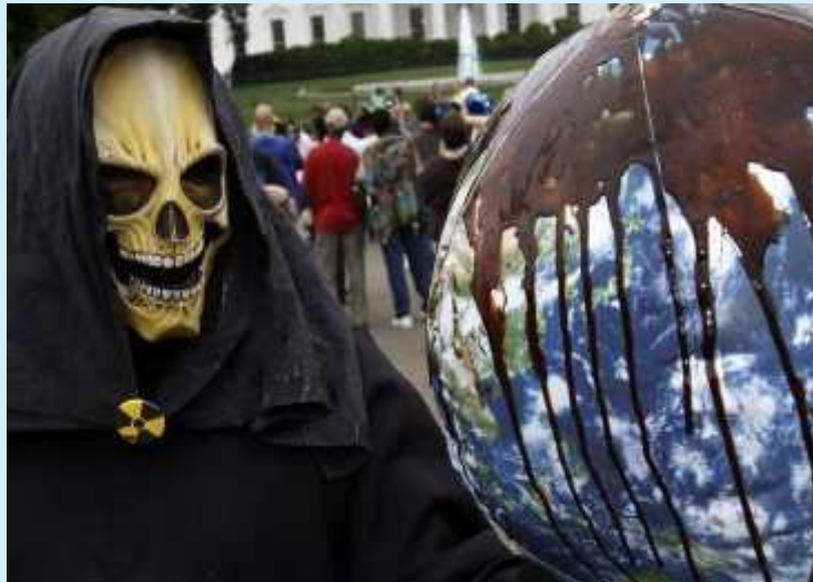
Manifestantes tomaron el frente de la Casa Blanca durante reunión Obama-BP

El petróleo llegará a costas cubanas y saldrá al Atlántico al incorporarse a la corriente del Golfo.