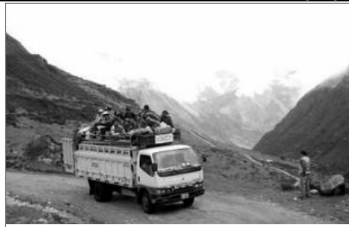
Camino al cambio

Este avance del poder popular, evidencia el retroceso del estado y la sociedad tradicional, las organizaciones populares se fortalecen cada día, al margen de los