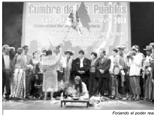
Forjando el poder real

Como en México, Bolivia, Ecuador, de lo profundo del Perú viene brotando la alternativa de Poder Real , moral, antiimperialista en esencia, que defiende el futuro, la vida, y que tiene como base las dos vertientes culturales indígenas: El colectivismo (amor al prójimo) y el amor a la naturaleza. El presente es lo real, nada será como antes, el futuro nos señala el camino, "del campo a la ciudad".